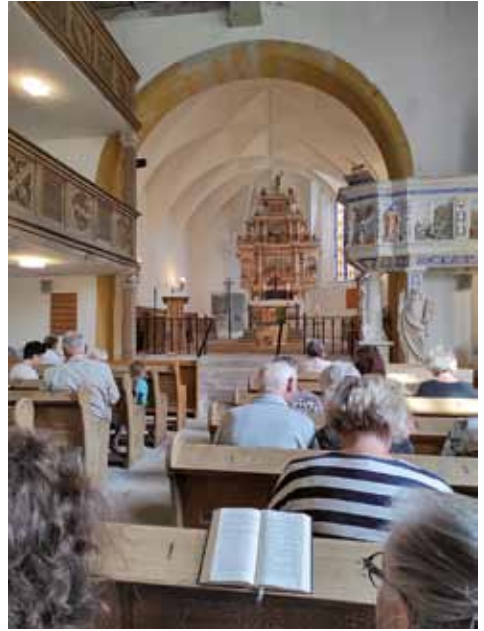
bei Orgel und Wein in Taubenheim