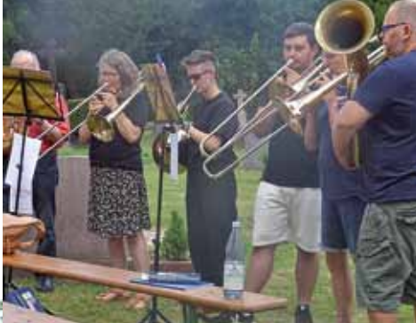
zum Johannistag in Heynitz