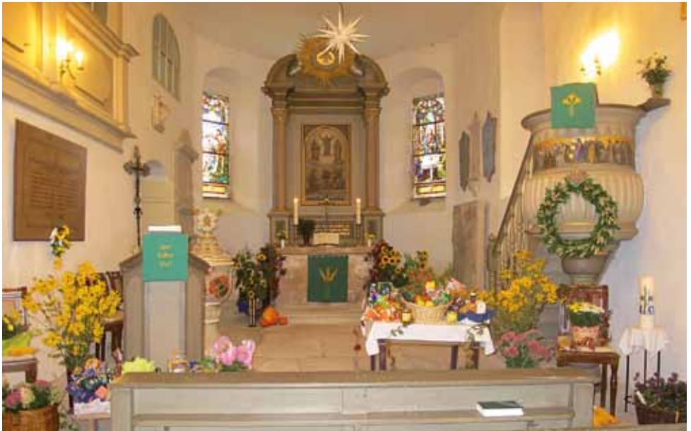
Erntedank in Tanneberg