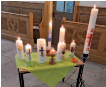
Beim Taufgedächtnis Taubenheim 2023