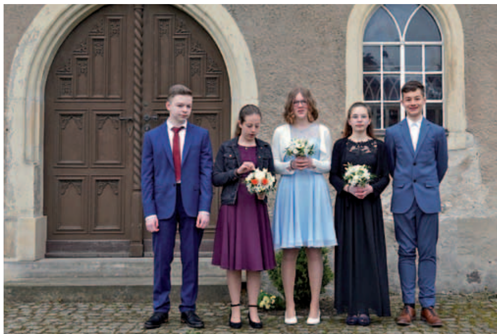
Die Konfirmanden 2023 in Taubenheim