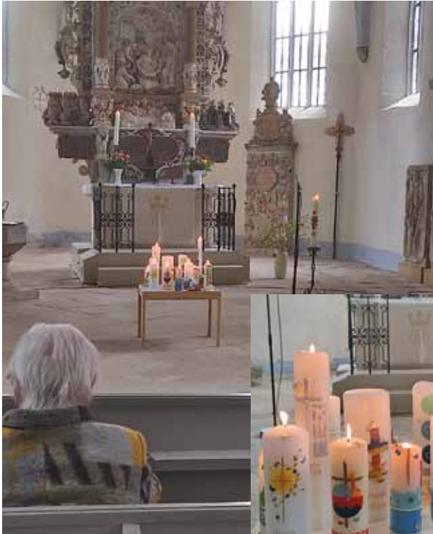
Taufsonntag in Burkhardswalde