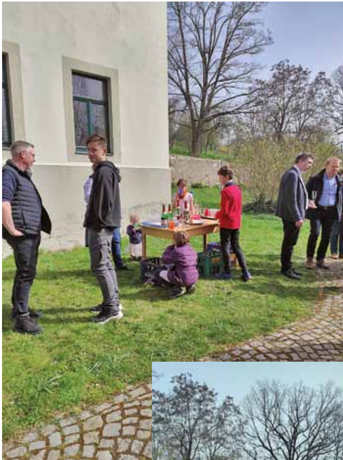
Ostersonntag in Burkhardswalde