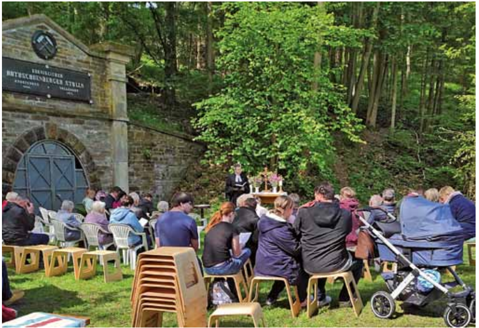
Zu Himmelfahrt am Roths Schönberger Stolln