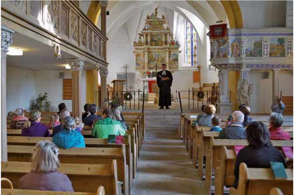
Reformationstag in Taubenheim