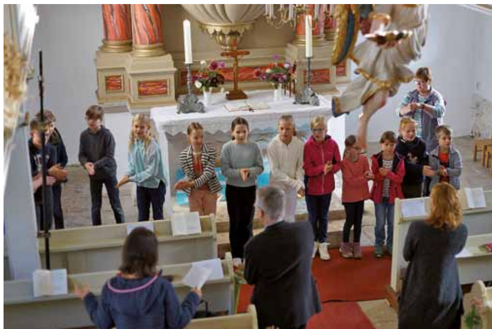
Abschlussgottesdienst der Kinderbibeltage