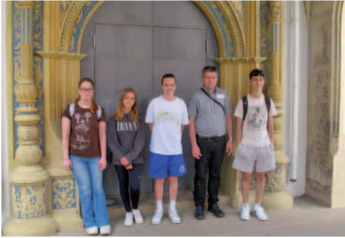
Konfirmandenfahrt nach Torgau