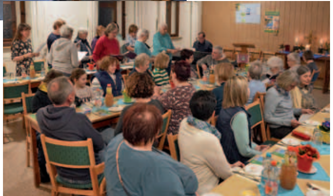
Weltgebetstag in Miltitz