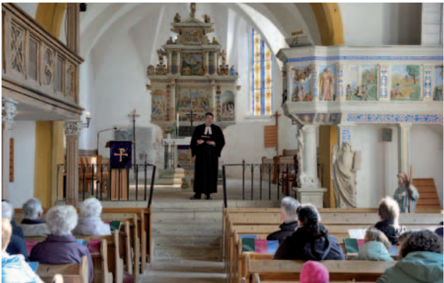
Bibelwochengottesdienst in Taubenheim