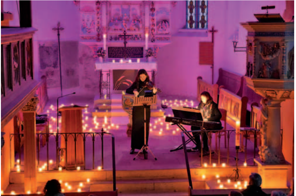
Candlelight-Konzert in der Kirche Taubenheim