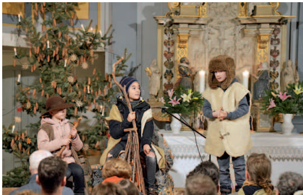
Krippenspiel in der Kirche Miltitz