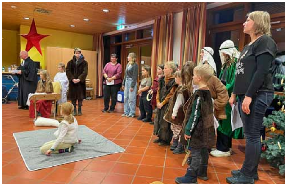
Krippenspiel im AWO Pflegeheim Taubenheim