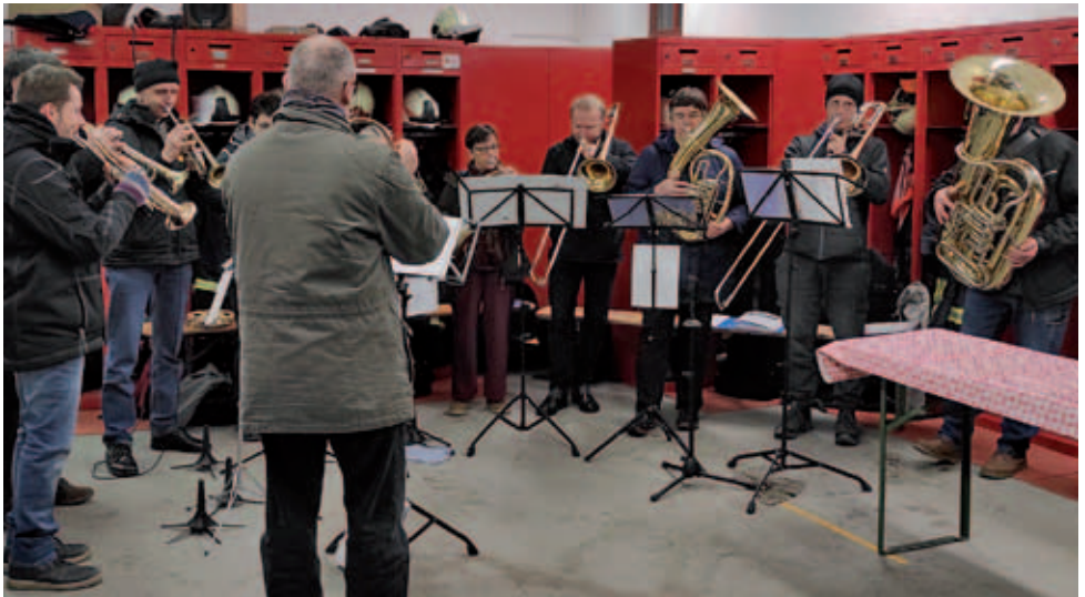
Der Posaunenchor bei der Freiwilligen Feuerwehr Burkhardswalde