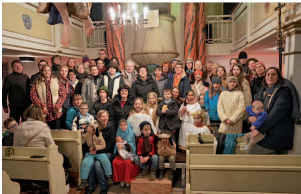
Krippenspieler in der Kirche Heynitz