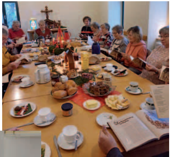
Frühstückstreff in Burkhardswalde