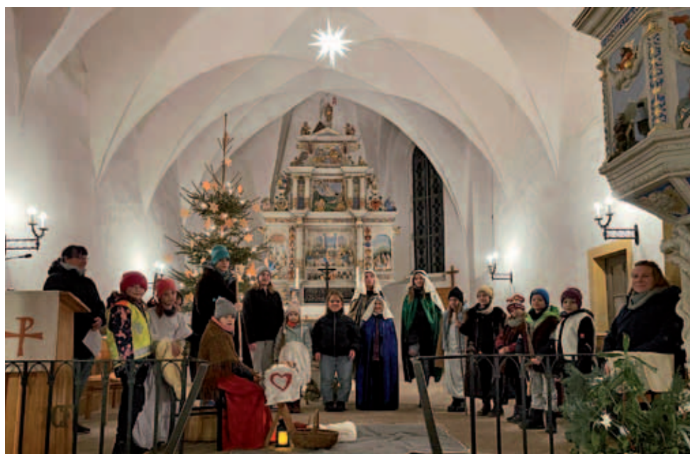
Krippenspiel in der Kirche Taubenheim