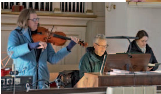
Gottesdienst in Heynitz

Titelbild: Motiv von Stefanie Bahlinger, Mössingen, www.verlagambirnbach.de