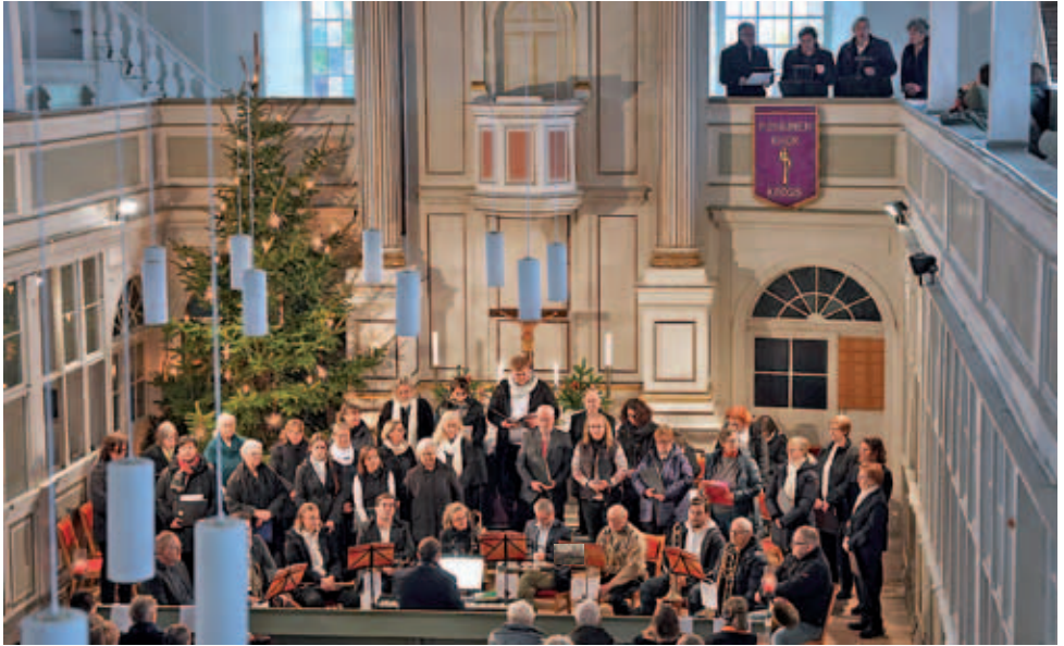
Konzert in Krögis