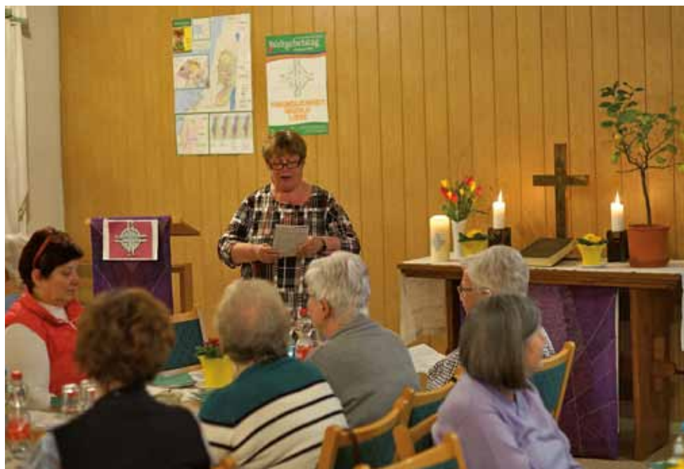
Beim Weltgebetstag 2024