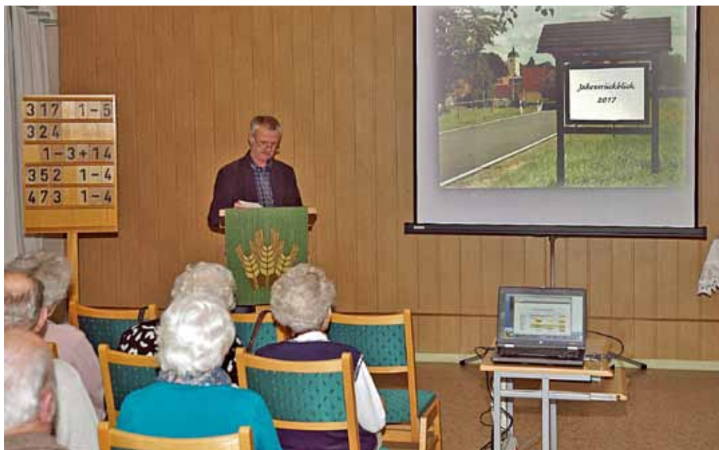
Beim Jahresrückblick in Miltitz