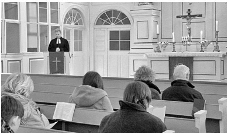
Zur Bibelwoche in Krögis